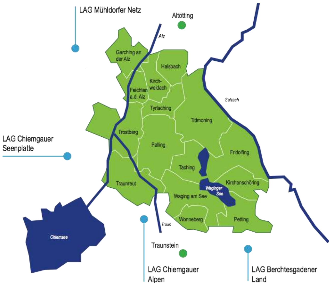
Abbildung 1: Die Region und weitere bestehende Initiativen